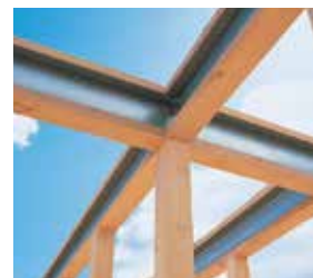
テクノストラクチャー 検索

テクノストラクチャーの家は木と鉄の複合梁「テクノビーム」と高強度オリジナル接合金具を使用し、さらに耐震実験や構造計算など、最先端の技術を導入した工法「テクノストラクチャー」を採用。木造と鉄骨の両方のメリットを活かしたパナソニック独自の「第三の工法」です。