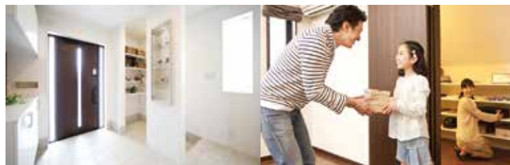
<エントランス収納> <ウォークインクローゼット>

1F6.3帖の独立した和室は、中庭が臨めます。お子様の遊び場として、ご家族のくつろぎスペースとして、客間として、様々なシーンで使用できます。