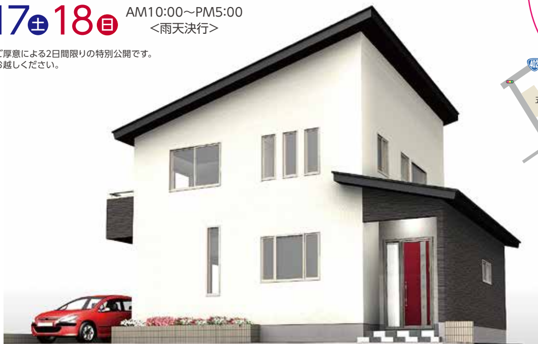
玄関ドアはご主人こだわりの赤い色に。シンプルながら、印象的な外観です。